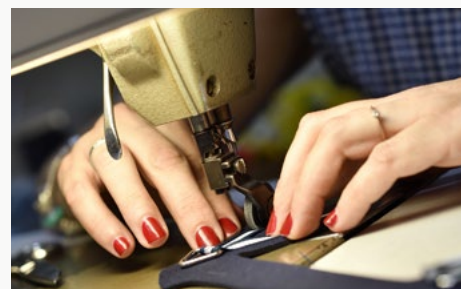
Tillverkning av handgjorda skor från Spaniens största sko- och sandalområde i Alicante-provisen.